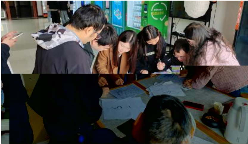
图 卓越团队建设共识营