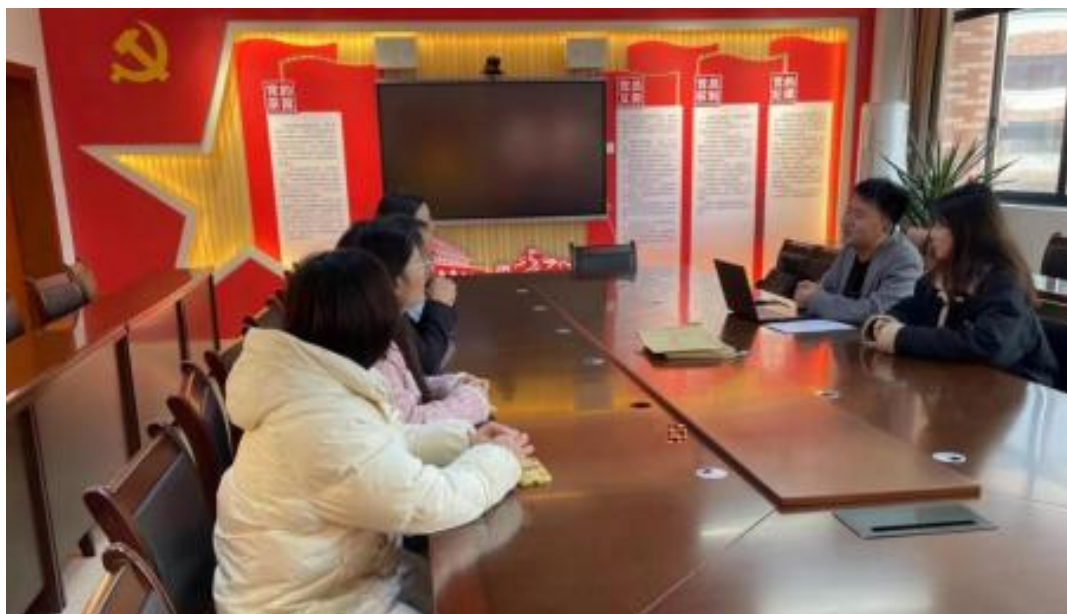
图 校企开展学术研讨项目交流会议

公 高度 队的 ，充分 到 和 的关 ，对 高 和 关 的 。此公 供 ，包 更 、 方法 及 导 发 程，并 持 丰富 的 家 过 、 会和 际案 ， 队 分 的 和 。 常 地 活动， 包 参加 会 、 等 ， 促 问 的 分 ， ， 并 的 队 ( 1)。